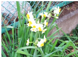
駐車場にひっそり咲いています