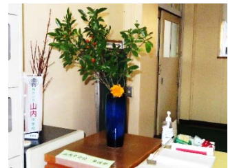
職員玄関に華道部が活けてくれます