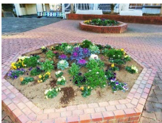
環境委員が週3回、 草むしりをしています