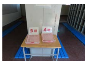
毎朝、健康観察表を提出しています。