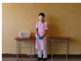
検温忘れやマスク忘れにも対応しています。