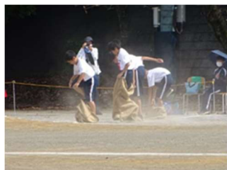
アドベンチャーレース