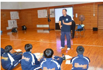
スポーツインストラクター

当日は一級建築士、キャリアカウンセラー、看護師(横浜看護専門学校)、警察官(旭警察署)、自衛官(神奈川県相談所)、建設業、IT関係、書店、スポーツインストラクター、幼稚園教諭、介護士、デイサービス、イラストレーターの方々に講話と体験をしていただきました。生徒たちはこの中から二つの講座を選び、職業の紹介、なぜその職業を選んだか、これまで努力してきたこと、今の夢など、講師の方々からの生きた声に耳を傾けていました。みんな熱心に話に聞き入り、積極的に手を挙げて講師の方々に質問するなど、意欲的に取り組みました。