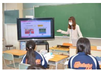
イラストレーター