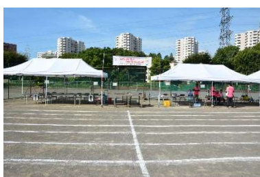
スローガンが本部に

また、来賓の皆様、保護者の皆様、2日間、生徒への声援や競技へのご協力、受付・パトロールのご協力などありがとうございました。