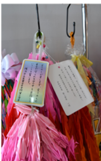
令和4年4月26日(火) 平和祈念公園資料館にて 令和3年度3年生 令和4年度3年生 千羽鶴贈答

このような感想を読んで、生徒たちがそれぞれ充実した日を過ごしたことがよくわかります。人とのつながりを大切に、自分の幅を広げていってください。