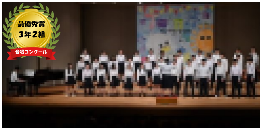
最優秀賞 3年2組 合唱コンクール