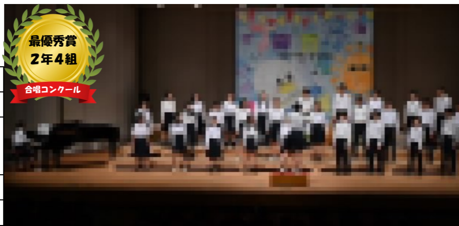
最優秀賞 2年4組 合唱コンクール