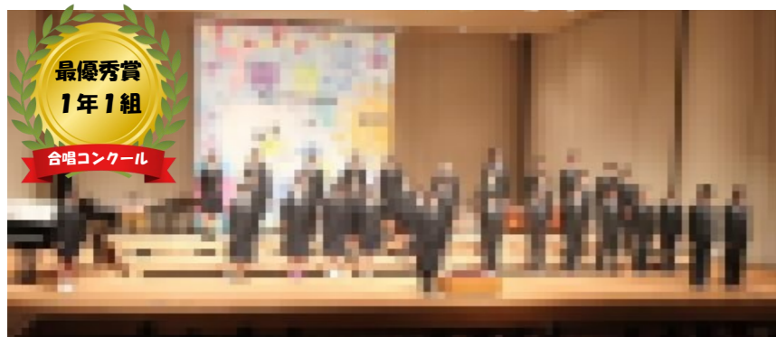
最優秀賞 1年1組 合唱コンクール

10月16日(月)～19日(木)の四日間で中央廊下の一階と3階、D棟3階書写教室で展示を行いました。美術や技術の課題作品や1年鎌倉遠足、2年自然教室、3年修学旅行のまとめを展示しました。また、本校の生徒作品だけでなく、並木第一小・並木中央小・富岡小、金沢総合高等学校の児童・生徒の作品もお借りして展示をさせていただきました。生徒は互いの作品に興味深く鑑賞していました。また、展示期間中には多くの保護者の皆様にご来校いただき、ありがとうございました。