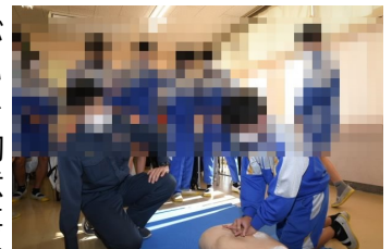
心臓マッサージを実践

2年 女子生徒 …消防団の方のお話を聞いたときに、「自分に大切な人がいるように、助けを求めている人にも大切な人がいるから、責任感を強くもっている」とおっしゃっていて、消防団や救急隊の方たちは、常にそのような責任をもって仕事をされているのだなど、改めて感じることができました。そして、胸骨圧迫やAEDの使い方について、実際に行いながら教わって、やるときの注意や流れについて、詳しく知ることができました。これから、本当にこのような事態に遭遇した時、自分は積極的にできる勇気はないかもしれないけど、その時は、勇気を出して助けたいです。