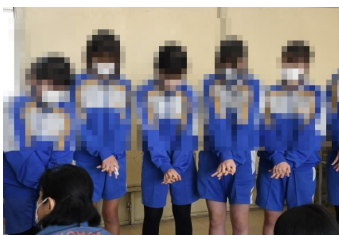
心臓マッサージ時の手の組み方を確認中

生徒は初めに、教室でビデオで基本的なことを学習した後、AEDの実技講習をグループ別に分かれて、講師の方々から受講しました。実技講習の場面では、丁寧にポイントを教えていただき、心臓マッサージとAEDの使用方法など、実際にどのような行動が必要なのか、また周囲への助力の為の声掛けや、注意喚起について学習しました。終了後に受講した生徒一人ひとりに「普通救命講習修了証」が渡されました。いざという時には、学んだことを十分に発揮してほしいです。