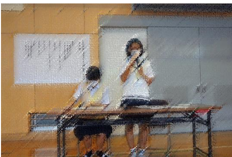
鶴見区 横浜子ども会議