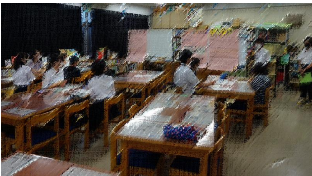
寺中ブロック会議

寺中生徒会役員は総合司会やSDGsの取組について、とても素晴らしい発表をするなど、子ども会議を盛り上げました。