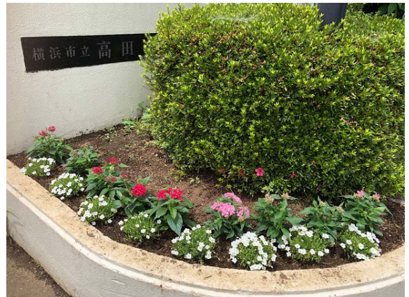
職場体験で種まきした白いニーレンベルキアの花

今年度は臨時一斉休業のため、様々な計画を変更せざるをえない状況にありますが、現在のところ、夏季休業期間の短縮や学校行事の重点化、家庭学習の充実や、試行錯誤ですがICT活用などの工夫を行うことで、全学年とも当初予定していた内容の指導を終えられるよう取り組んでいければと思っています。今後の感染状況によっては特例的な対応がでてくることもあると思いますが、子どもたちを学校と保護者とがともに見つめ、育んでいけますよう、引き続きご理解ご協力をよろしくお願い申し上げます。