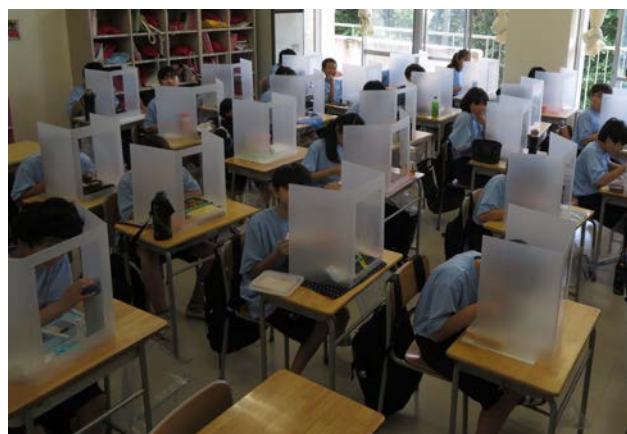
特命：たか中研究開発製造部メンバー