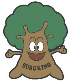
学校マスコットキャラクター：すすっきー