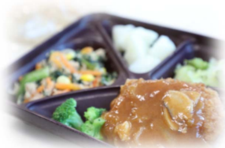
中学校給食メニューの例 (チキンカツ・デミグラスソース、ツナと小松菜のソテー など)

利用方法 (横浜市中学校給食のサイト https://kyushoku.city.yokohama.lg.jp/ )