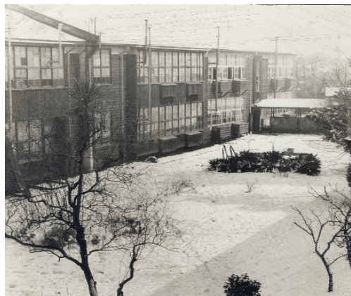
創立当時 雪景色の中の校舎

今後も、歴史と伝統のある瀬谷中学校が、ますます発展するよう職員一同努力を続けていきたいと思っております。保護者の皆様のご理解とご協力をお願いいたします。