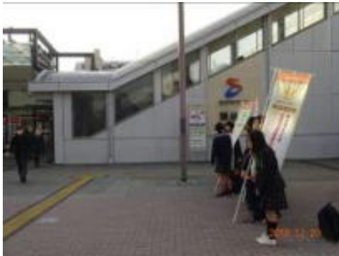
瀬谷駅前でのあいさつ運動の様子

私はあいさつは人と人をつなげる大切な言葉であると思っています。朝、とても元気なあいさつをすると、された側の方は現気になります。私はそんなあいさつが地域に広がってほしいと思っています。だから、今回瀬谷小学校と瀬谷駅北口であいさつ運動を行いました。あいさつを返してくれる人が多く、あいさつをしていた私たちも朝からとても元気になりました。この学校でもあいさつをしてくれる人が増えてほしいと思っています。