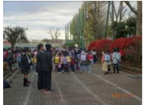
瀬谷小でのあいさつ運動の様子