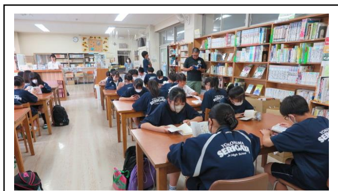
図書館 de 朝学活の一場面