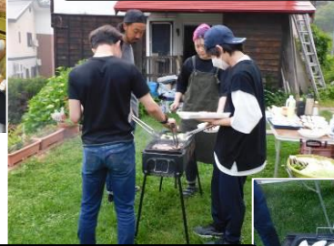
おいしいご飯をたくさん食べました。