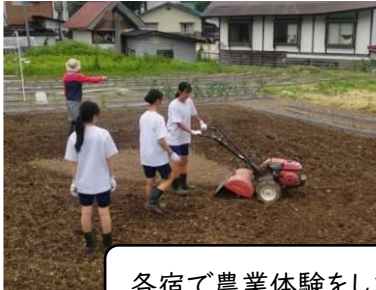
各宿で農業体験をしました。