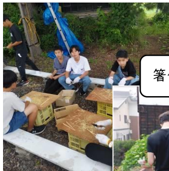
箸作り。さっそく使った？