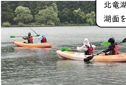
北竜湖でカヌーを体験しました。湖面をなめらかに進んでいます。