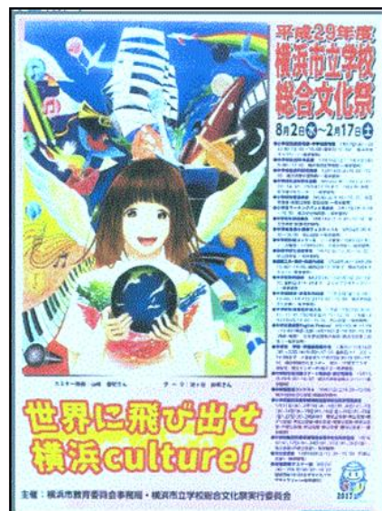
最優秀賞 (3-2 女子)

横浜市立学校の児童生徒が学習の成果を発表する「横浜市立学校総合文化祭」の開催ポスター原画募集コンクールで、左近山中学校美術部生徒が 8 名入選しました。特に 3 年 2 組女子の作品は『最優秀賞』に選ばれましたので、市内の全校に配布・掲示される右のポスター & ちらしに採用されました。入選作品は 1/25～1/30 図画工作・美術・書道作品展(横浜市民ギャラリー)でも展示されます。なお美術部生徒作品は文化祭武道場作品展示でも油絵他、多数展示致します。ぜひご覧ください。(美術部顧問 稲葉 明美)