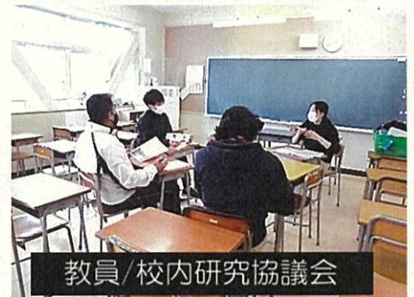
教員/校内研究協議会

2月上旬、授業参観を計画しておりましたが、まん延防止重点措置が発令されたため、急遽、中止といたしました。その中、校内では、「言語能力」や「自分づくりの力」の育成に重点を置く授業研究会を開催しました（国語、社会、数学、美術、音楽）。授業後は、研究授業別の協議会で、教職員同士、授業について話し合い、他教科へ生かしていく視点を共有しました。