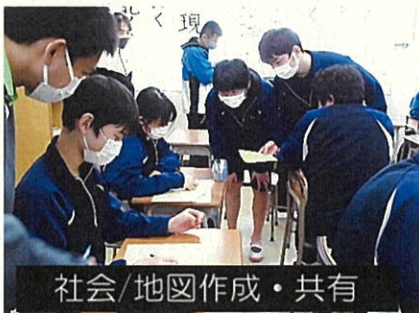
社会/地図作成・共有