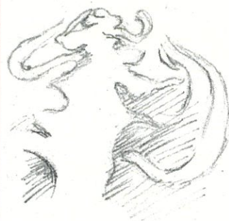
部分を くわ 詳しく

①モチーフのキャベツをいろいろな方法で観察してみる。 それらのスケッチを描き、形や構造の特徴をとらえる。