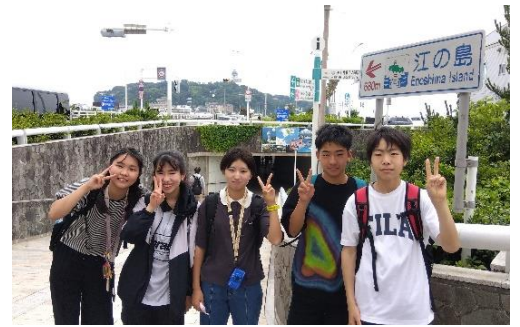
【江の島をバックに「ピース！」】