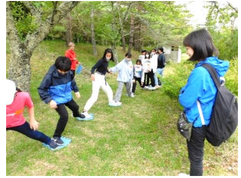
【ミッションクリアに奮闘中（1日目）】

1日目は「人間関係づくり」を体験的に学ぶPAA活動（プロジェクト・足柄・アドベンチャー）に取り組み、2日目は富士五湖のうち三つの湖が眺められる三湖台まで（往復約4km）のハイキングをしました。