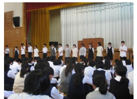
【 自らの想いを語る部長たち → 】

6月16日6校時、全校集会の中で、これから市大会やコンクール等に挑む部活動の生徒たちを激励するために、部活動壮行会を行いました。各部の部長が思い思いにこれまでの取組や周りへの感謝の気持ち、大会等の目標や決意を熱く語りました。全校生徒が激励の意味を込めて、大きな拍手を送りました。‘ガンバレ、岡津中学校 部活動！’