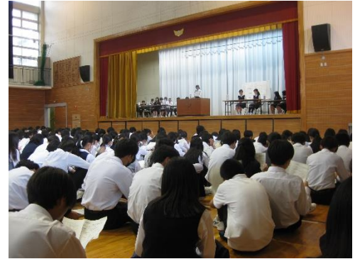
【心地よい緊張感が感じられた生徒総会(5/31)】

1学期も3カ月が経とうとしています。今学期はスタートよりすべての生徒活動をほぼ計画通り順調に行えていることが、何よりも嬉しいです。また、各学年の校外学習を安全に無事終えることができ安堵しているところです。5月の生徒会朝会、生徒総会、そして今月の全校集会も、全校生徒が一堂に会して実施することができました。それぞれの活動や行事からは、その趣旨を踏まえての一体感が感じられ、生徒の皆さんには、引き続きこの（学級や学年、全校での）まとまりを大切にしてもらい、「チーム岡中」として、2大行事（体育祭や文化祭・合唱コンクール）の取組に向かっていくことを大いに期待しています。