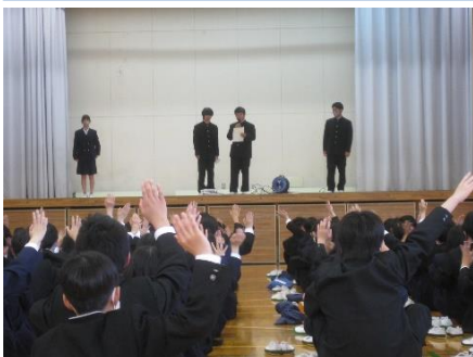
【学校生活オリエンテーション ○×クイズの一コマ】

4月11日、3年ぶりに対面による新入生を迎える会を体育館で行いました。生徒会本部役員が進行し、新入生へ2、3年生から校歌披露や記念品（洋蘭：デンドロビュームなどの鉢植え）贈呈をしました。新入生代表がお礼の言葉を述べ、最後に歓迎の気持ちを込めてくす玉割りを行いました。生徒会長とじゃんけんでくす玉割りする人を決めたときは、全校生徒が一体となって盛り上がっていました。新入生をあたたかく迎えようとする2、3年生を身近に感じる場面となり、緊張感が続いていた新入生の表情が大きく和らぐ様子が窺えました。引き続き行われた新入生への学校生活オリエンテーションも立派に運営した生徒会本部役員の皆さん、大変お疲れさまでした。