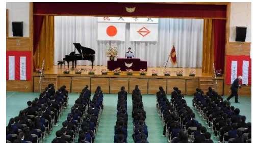
【7日入学式：新入生代表誓ひの言葉】

4月7日、体育館で午前には始業式、午後には入学式を行いました。いずれの式の中でも私からは、自らの学校生活を充実させるために