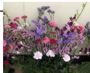
【入学式を飾った華道部の生け花】