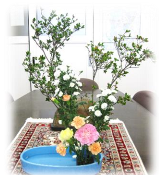
< 華道部 > 校長室にて 井上保奈美さん・齋藤優羽さん作

リオ五輪男子400mリレー銀メダリストの桐生祥秀は「みんなで乗り越えよう」といい、続けて「全中がなくなりインターハイ