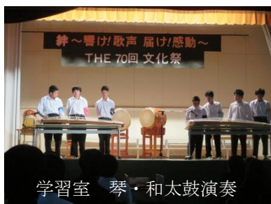
学習室 琴・和太鼓演奏