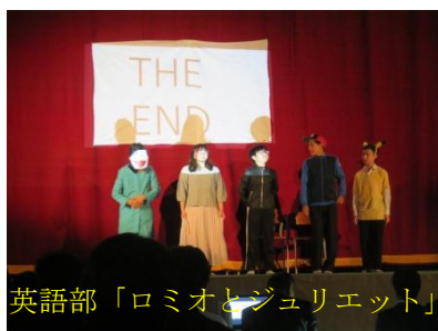
英語部「ロミオとジュリエット」