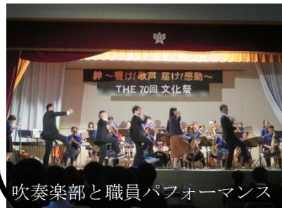
吹奏楽部と職員パフォーマンス