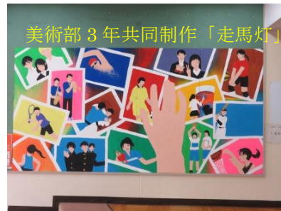
美術部3年共同制作「走馬灯」