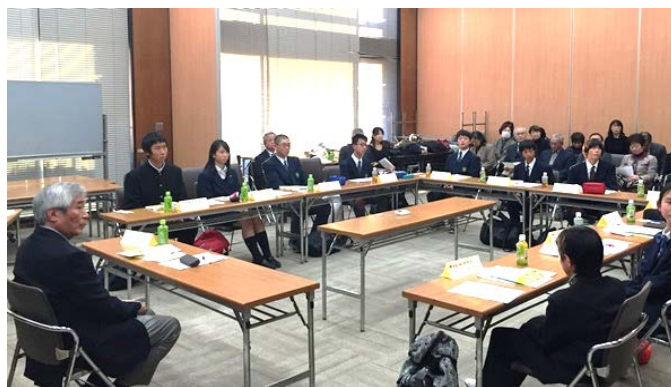
中区中学校人権トーク（中区役所会議室）

気付くこと、相手の気持ちになること、自分自身はどうであったか、しっかりと振り返って考えてみようと思いました。