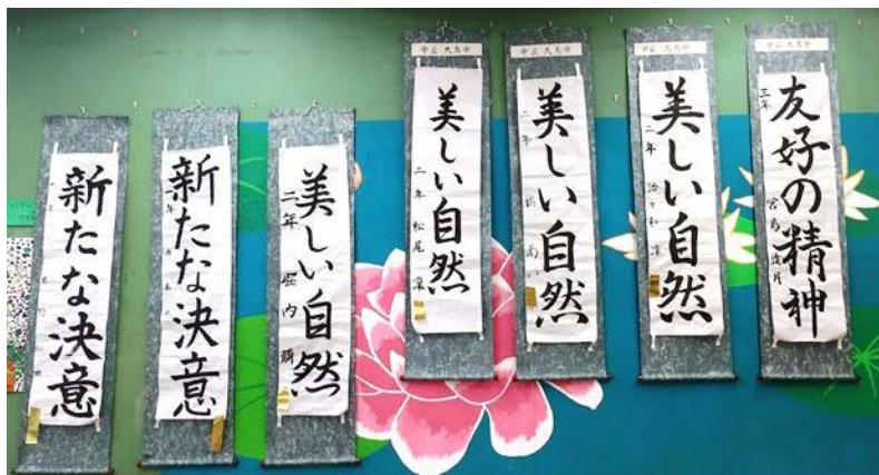
ふれあいに展示された優秀作品（右端が横浜市総合文化祭に出品された）

冬休みの課題でもある「書初め展」が行われ、各学級での展示、優秀作品の1階ふれあいコーナーへの展示が行われました。優秀作品（金賞）のうちの4点については、さらに横浜市立学校総合文化祭中学校書写展や中区書初め展に出品されました。