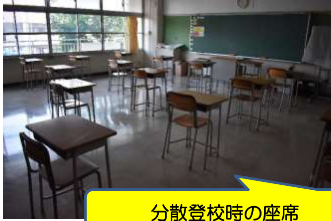
分散登校時の座席