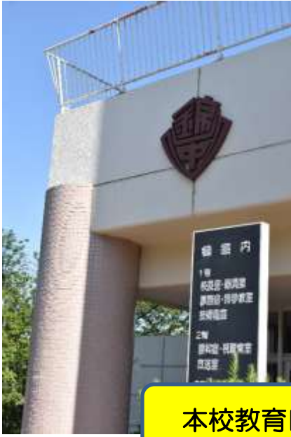
本校教育目標「自立貢献」