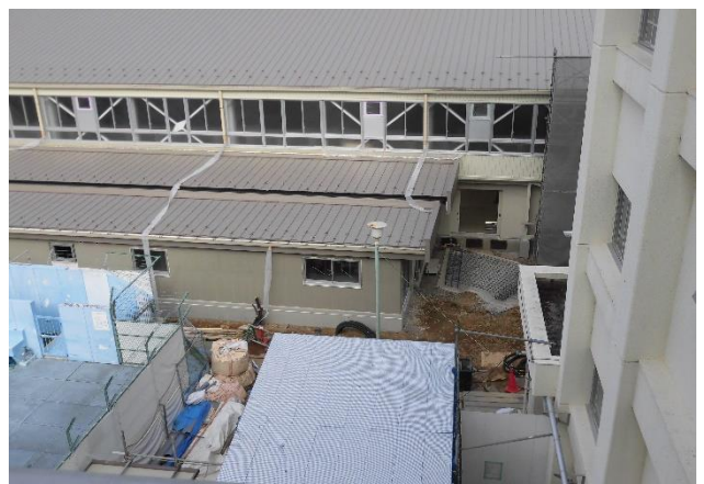
校舎から体育館への渡り廊下の工事です。基礎をしっかり築いています。(1/25)