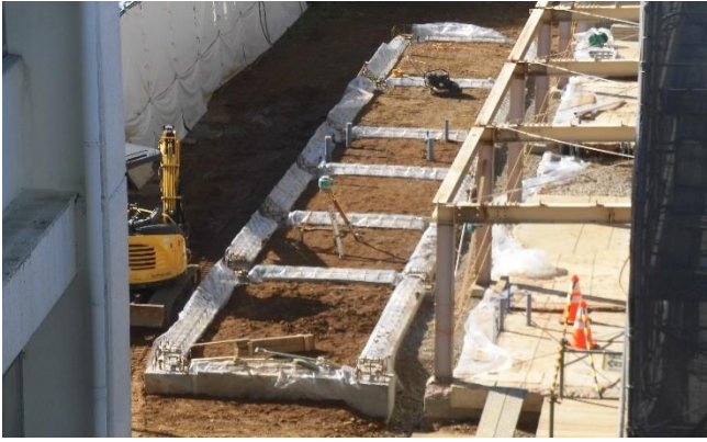
基礎をしっかり築いて、掘り起こした土を埋め戻しています。(11/4)