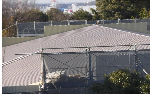
屋根の工事です。左は断熱材？を敷き詰めているのでしょうか？右は屋根の部分が完成したようです。(12/3)