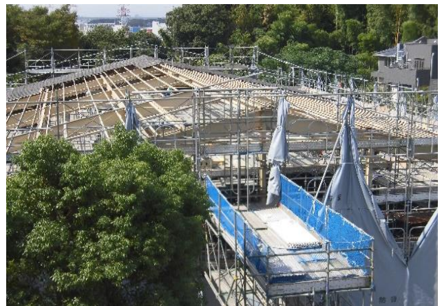
屋根をはがして、鉄筋の部分のペンキの塗り直しや補修をしています。(9/30)