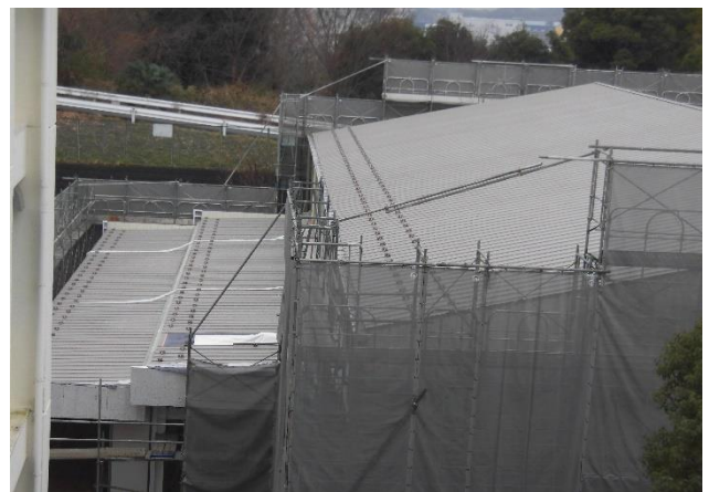
付帯設備（倉庫等）の部分の拡張の工事です。屋根が完成しました。(1/11)