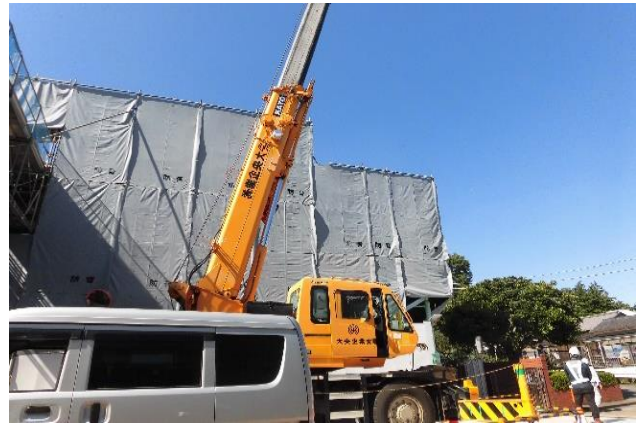
クレーン車で屋根の部分の鉄筋やその他重量のあるものを運び入れています。(9/29)