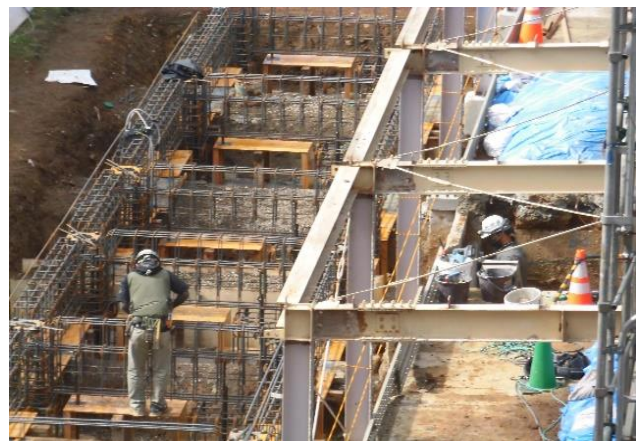
付帯設備の部分を広げています。広い倉庫になります。基礎をしっかりと固めています。 (10/11)