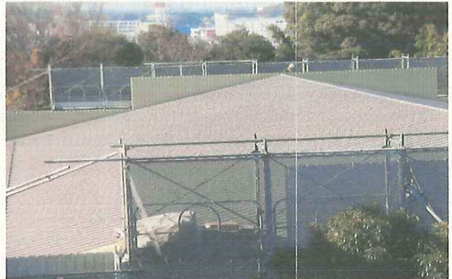
屋根の工事です。左は断熱材？を敷き詰めているのでしょうか？右は屋根の部分が完成したようです。(12/3)