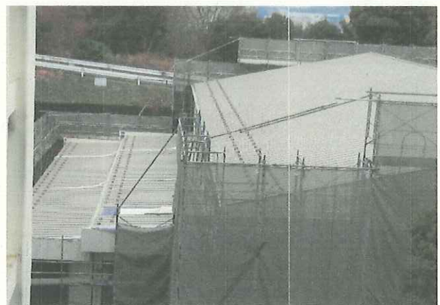
付帯設備（倉庫等）の部分の拡張の工事です。屋根が完成しました。(1/11)