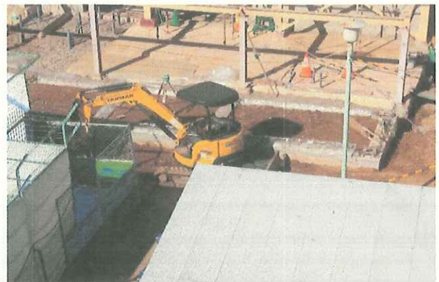
基礎をしっかり築いて、掘り起こした土を埋め戻しています。(11/4)