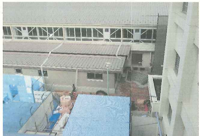
校舎から体育館への渡り廊下の工事です。基礎をしっかり築いています。(1/25)