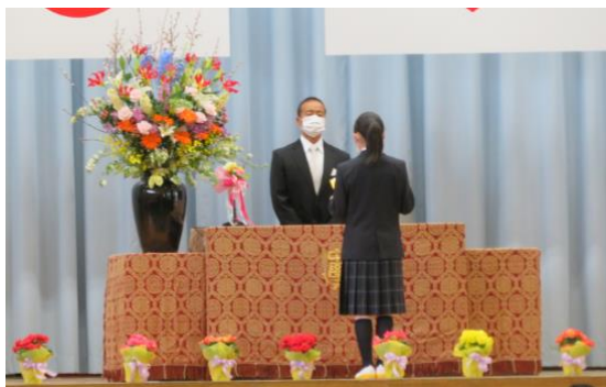
新入生誓いの言葉：新入生代表者

多くの支えに感謝し、多くの学び、大切な思い出、仲間との友情を「温かく強い心」と表現し、この生麦中学校に入学することを表してくれました。また、生麦中学校の生徒として、自覚と誇りを持ち、より良い生麦中学校をつくることに一生懸命取り組み、仲間と支え合い・励まし合いながら進んでいくこと、自分たち夢に向かって頑張ることを伝えてくれました。