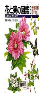
『花と実の図鑑6 身近な樹木の1年』 分類番号470 成成社