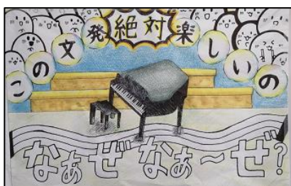
今年のスローガンです

合唱コンクールについて、一つ皆様に知っていただきたいことがあります。それは、会場のことです。今年度は県民ホールで開催をいたしますが、次年度はどここの会場になるかまだ決まっていません。本校の生徒数で、保護者の皆様にも観覧いただくためには、利用できるホールは4つほどしかありません。それらはすべて抽選となります。この時期には多くの団体が利用を希望することもあって、毎年会場の確保に苦勞をしています。年により会場が変わるのはこのような事情がありますので、ご理解のほどよろしく願います。