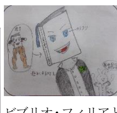
ビブリオ・フィリアと ブックマン2世