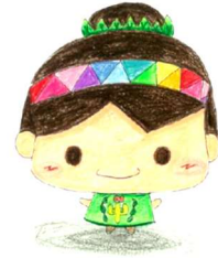
中川中スクールキャラクター 「みどりん」