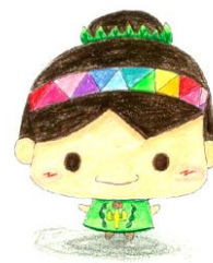
中川中スクールキャラクター 「みどりん」