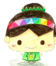
中川中スクールキャラクター 「みどりん」