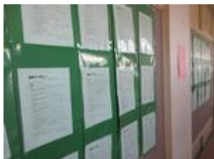
←廊下壁面に掲示されたレポート