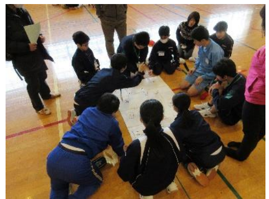
ゲームに集中し協力する班の仲間たち

2月16日、東山田中学校体育館において、都筑区中学校個別支援学級交流会が行われました。今年1年間、区内中学校8校の個別支援学級の生徒たちが、他校と混合班を編成し、遠足や宿泊行事などに取り組んできました。今回の交流会は、これまで後輩たちのリーダーとして活躍してきた3年生に感謝の気持ちを伝え、卒業を控えた3年生を祝福する今年度最後の会となりました。