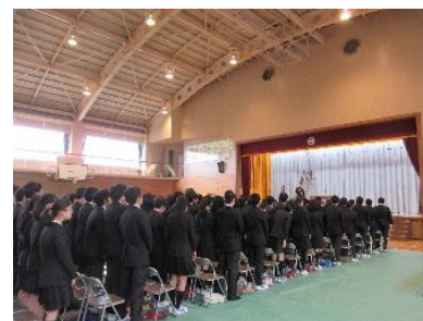
初めての卒業式練習

談、出願、入試とあわただしく毎日が過ぎ、気が付くと卒業式まであとわずかとなりました。3年生は、卒業に向けた特別日課となり、卒業式の練習、学年行事に取り組んでいます。なお、卒業証書授与式は、3月9日(金)に行います。