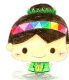
中川中キャラクター 「みどりん」