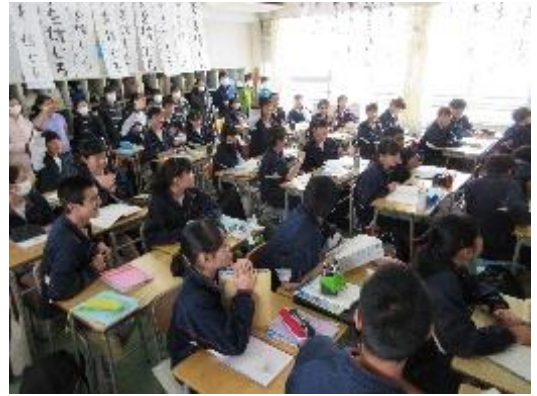
授業を熱心に参観する小学生のみなさん

1月31日に中川小学校、2月1日に南山田小学校と牛久保小学校のみなさんが、本校1・2年生の授業を参観しました。4月から中学生になるみなさんは、小学校より大きな施設環境や教科担任制など、いつもの小学校生活とは異なる学習環境に興味津々。4月からの中学校生活を思いながら、熱心に参観していました。学習している中学生に1年後の自分の姿を重ねると、これから1年間の成長が確認できると思います。