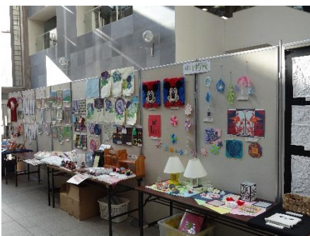
生徒たちの作品が展示されていました

12月5日から4日間都筑区役所区民ホールにて、都筑区・青葉区港北区の中学校個別支援学級の生徒たちが、授業等で制作した作品が展示された作品展が行われました。