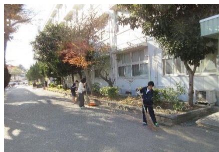
美化委員と教員が昼休み落葉掃き (陸上部員も朝練で落葉掃き)