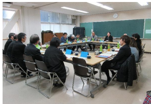
子どもたちのために熱心な意見交換

また、今回の小中合同の試みについては、小中学校の委員同士のつながりによって、先生たちのつながりにもアドバイスできるのではないかとのご意見もいただきました。