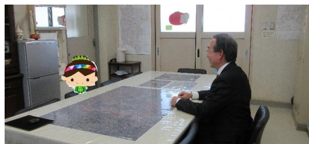
本校キャラクター『みどりん』も校長面接!?

学校の大晦日は 3 月に訪れますが、新たな気持ちと決意で迎える新年は、学年のまじめに向けた最後のターニングポイントになります。よいお年をお迎えください。