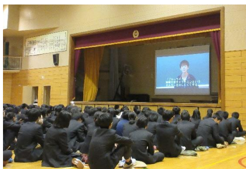
保健委員会作成の動画を見る生徒たち

12月12日の朝会は、保健委員が企画・運営を行う「保健朝会」でした。保健委員が「睡眠」をテーマに動画を作成し、クイズを織り交ぜながら面白おかしく、全校生徒に睡眠の大切さを投げかけました。夜遅くまで起きていることにより、学習や運動など学校生活のあらゆる場面で本来の力を十分に発揮できない主人公が失敗と後悔の連続となる学校生活を熱演し、笑いの中にも大切なことを考えさせられる朝会でした。また、朝会后、3年生を対象に学校薬剤師の先生を講師にお迎えし、『薬物と人生』という題材でお話をしていただきました。