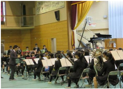
オープニングは中川中吹奏楽部演奏