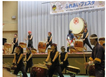
和楽会『昇』による太鼓の演奏

12月2日（土）、本校体育館において、「第3回ふれあいフェスタ」が開催されました。中川中学校区の3小学校の児童の皆さんと本校吹奏楽部、科学部のみなさんが出演しました。また、写真部の作品も会場に展示されました。