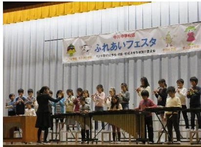
小学生の皆さんの合奏