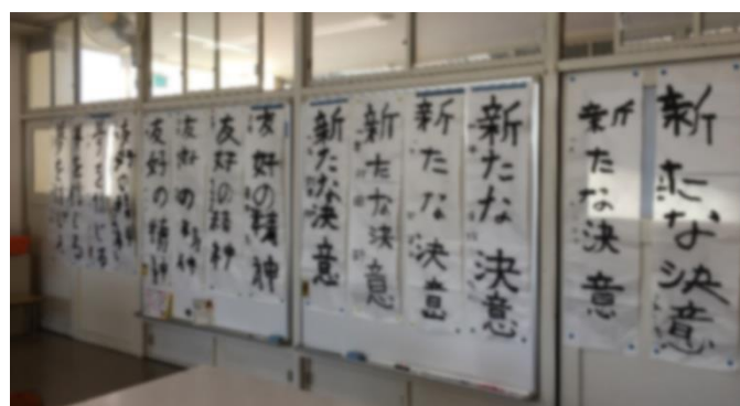
7 組 書初め

保護者の出席について等、詳細につきましては検討中です。決定後、改めてお知らせいたします。ご理解いただきますよう、お願い申し上げます。