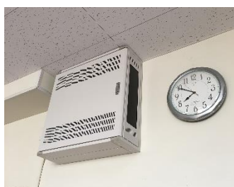
LAN 整備のため、各階に取り付けられたスイッチ BOX

GIGA スクール構想実現に向けて、中田中学校でも準備が着々と進んでいます。12 月には学習動画のテスト配信による家庭と学校とのオンラインでの接続確認をさせていただきました。多数のご協力、ありがとうございました。今月は、校内 LAN の整備工事や、充電保管庫が設置されました。