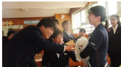
【カトリミングスクール様】