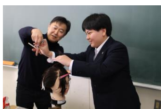
【ヘアサロン NEO 様】