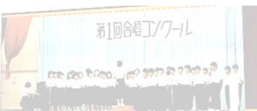
1985年 第1回合唱コンクール(森中学校体育館)

合唱コンクールの終わりには、「先生、俺ら明日から学活の時間何して過ごせばいいの?」と合唱ロスになり、「次はあの先輩の歌を歌いたい」と1年後に思いを寄せる生徒がたくさんいたそうです。