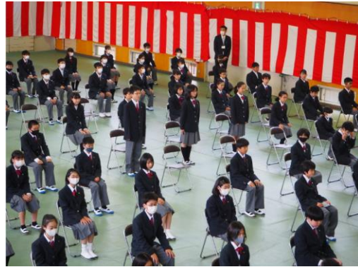
新入生代表のこたば