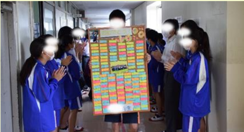
先日、1先生が入籍しました！！ 2年生全員でサプライズのお祝い！特大メッセージボードをプレゼントされ、とても喜んでました。 未永くお幸せに！ ちなみに、1先生に奥さんのことを聞いても全然教えてくれません。