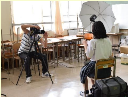
3年生の卒業アルバム用写真撮影 とても陽気なカメラマンさんでした