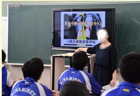
3年生進路ガイダンス 高校の先生が来校し、説明してくれました。