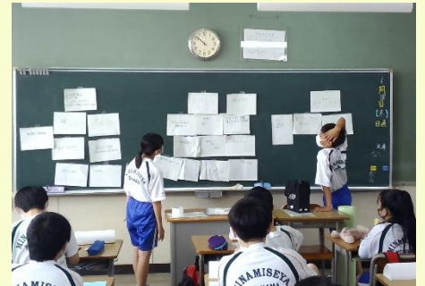
1年生、学級目標の話し合い クラスがひとつになるために学級目標は大切