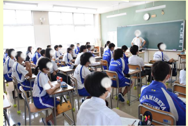
こんなにもにぎやかに！