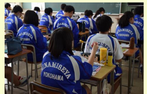
昼食もスタート。感染予防対策をしっかり 守り、一言も話さずに黙々とモグモグ。