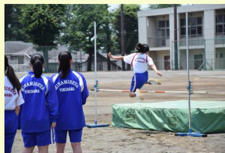
グラウンドでの授業も始まりました。