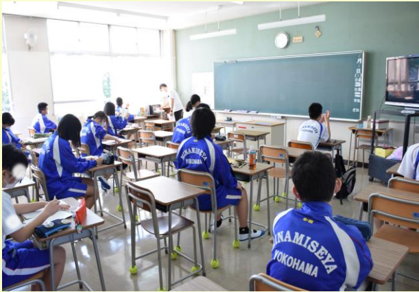
さみしかった教室が…