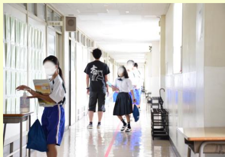
先生「チャイムなるぞー急ぐぞー」 短い休み時間。教室に急ぐ1年生たち