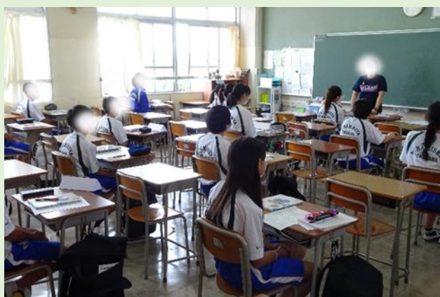
体育の授業。しばらくは教室で座学。 体を動かしたくてウズウズするねえ