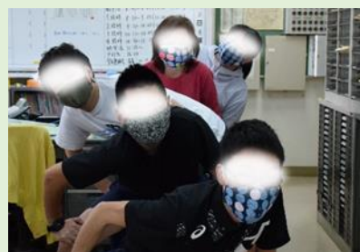
いつもお世話になっている宮沢地区の地域 方から、職員用のマスクの差し入れをいた だきました。励まされます！