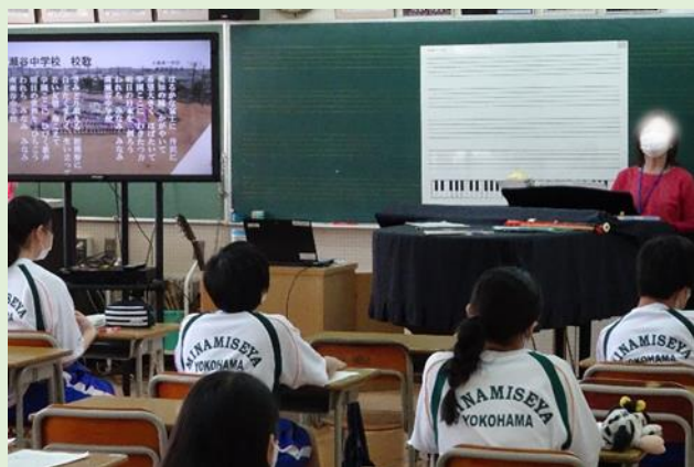
1年生。音楽で校歌の授業。もう覚えたかな？ みんなで大きい声で歌いたくなっちゃう。