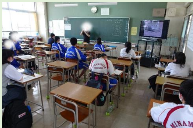
だんだんと体操着登校率が高まってきた。 体育がある日は必ずジャージ登校です。