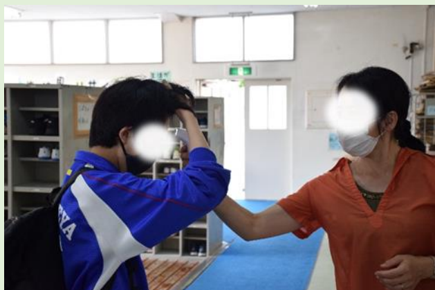
登校時、検温を忘れた生徒は非接触の体温計で“ピッ” 1日20~30人くらいこのような生徒が。忘れないでね。