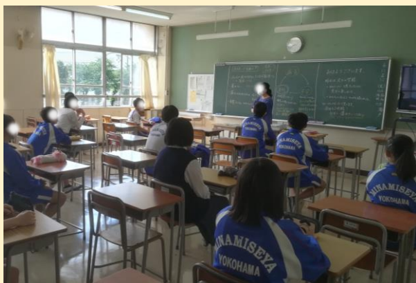
今日からはジャージ登校・制服登校が各自で選択