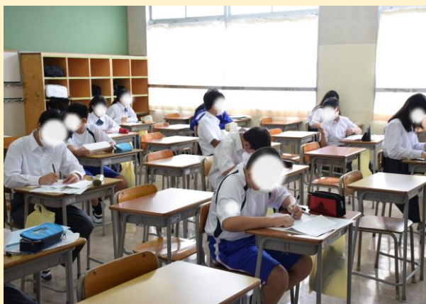
1年生は学校で初めての教科の授業。緊張した？