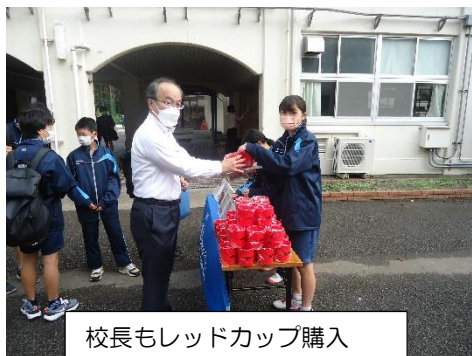
校長もレッドカップ購入

今年度の第2回進路説明会は、第1回進路説明会と同様に生徒と保護者の方の合同で5時間目に行いました。今回は、進路主任から、11月以降の進路希望先決定に向けての実務的な話がありました。