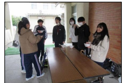
【地域総合防災訓練で豚汁をいただきました。】

文末になりますが、学校に係わっていただいた全ての方々に厚くお礼申し上げますと共に、これからも教育活動へのご理解とご協力をよろしくお願いします。