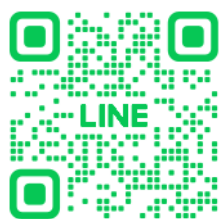
登録 QR コード