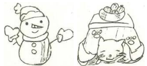
イラスト:イラストレーション部

冬休み明けに生徒のみなさんが提出した書き初めが、各教室に展示されました。選ばれた優秀作品は、横浜市中学校書写展、緑区書き初め展に出品されました。どの生徒たちの書き初めも、堂々とした立派な作品でした。新年を迎えて、今年もがんばろうという気持ちが文字に表れていました。