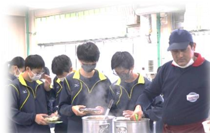
カレーのスパイス講座