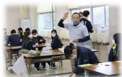
畳のヘリで小物づくり

今年の文化祭のテーマは「つながり」でした。このテーマをもとに「えん結び」というスローガンのもと、生徒一人ひとりが様々な想いを胸に文化祭に取り組んできました。昨年度できなかった合唱コンクールの練習では、先輩や後輩と合唱交流を行い、学年を超えたつながりが生まれました。新しくできた「校歌」について文化祭実行委員会が中心となって見つめなおし、校歌に込められた想いや過去の先輩方とのつながりを感じることができました。そして、PTA 役員や地域のみなさまとのコラボ企画も実現し、地域とのつながりを感じることができました。この文化祭を通して、丸山台中学校が多くの人に支えられているとともに、たくさんのつながりの中に毎日があるのだと感じさせられる2日間でした。多くの保護者のみなさまにも文化祭の様子を見ていただき、生徒もいつも以上に力を発揮することができたと思います。この2日間でも生まれた「つながり」をこれからの生活でも「まちに生きる」という意識を大切にしていけたらと思います。最後になりましたが、文化祭の開催に関わってくださったすべてのみなさまに感謝いたします。ありがとうございました。