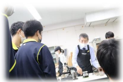
コーヒーの基礎知識