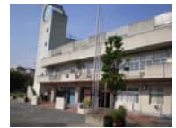
南太田小学校 Tel 731-9001

平成24年度より、横浜市立小・中学校では、全142ブロックで「横浜型小中一貫教育」が全面的にスタートしました。「横浜型小中一貫教育」とは、敷地や校舎を共有するなどの物理的な条件に関係なく、小中学校教職員が情報交換や連携をして、義務教育9年間の連続性を図った小中一貫カリキュラムに基づく教育活動を推進することです。このことによって、子どもの学力の向上や児童生徒指導上の課題の解消を目指します。