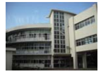
蒔田小学校 Tel 712-2300