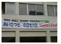
蒔田中学校 Tel 711-2232